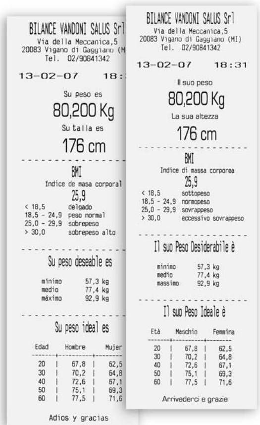
Scontrino dettagliato Ticket detallado